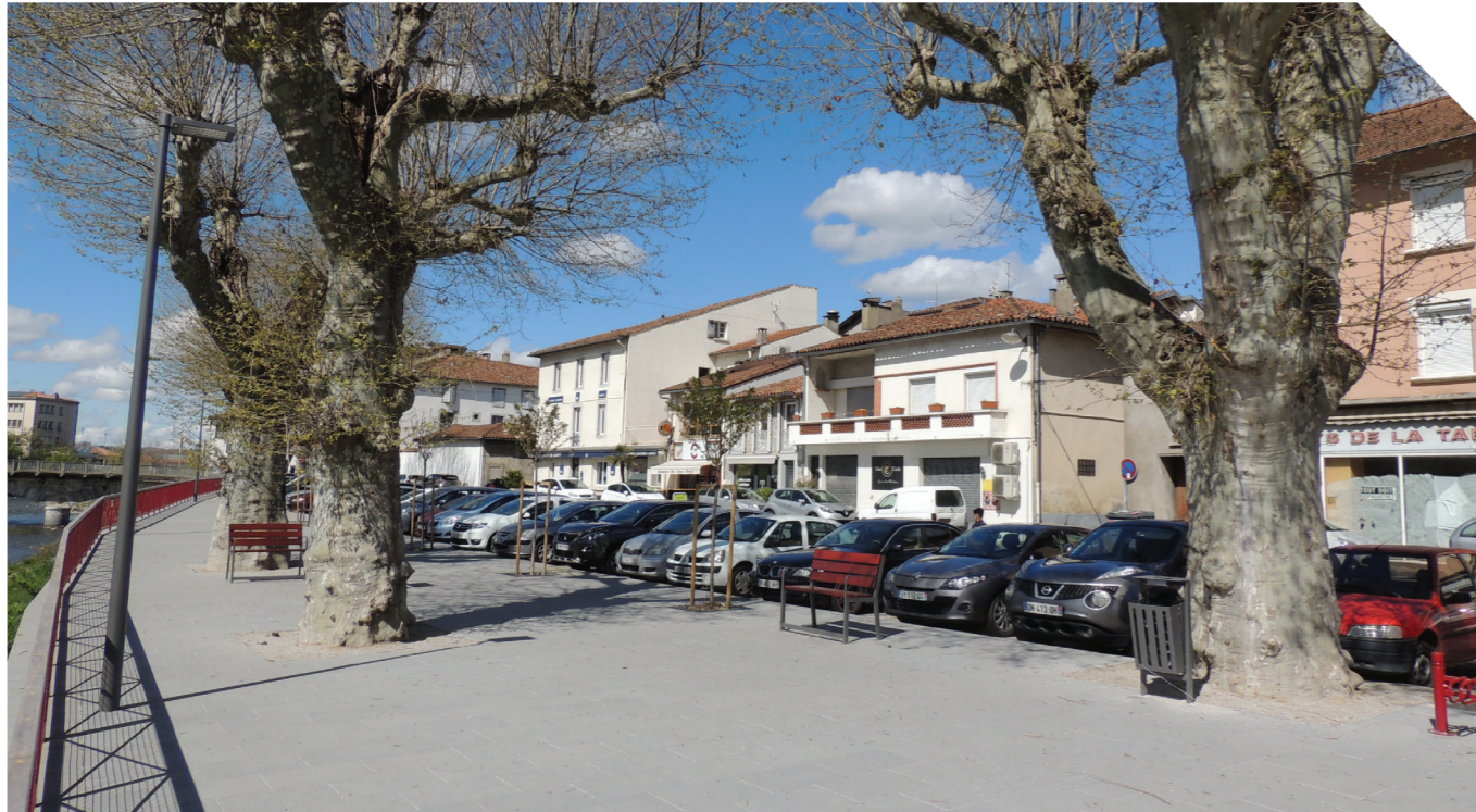
Le quai du Gravier a complètement été refait en 2018

Le débat d'orientation budgétaire s'accompagnant de la production d'un rapport du même nom a eu lieu le 12 mars dernier en conseil municipal. Le but de cet éclairage, qui a lieu dans les deux mois précédant le vote du budget, est d'améliorer l'accès à l'information vers une plus grande transparence des actes budgétaires et financiers pour les administrés.