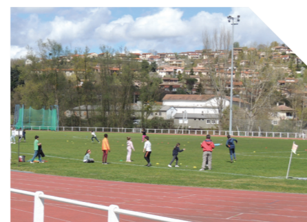
Des enfants peaufinent leurs jeux de jambes au stade Jo Boussion

les classes de CM2 du groupe scolaire Henri Maurel et de Lédar ont participé l'année dernière à la journée départementale de sensibilisation à divers sports qui s'est déroulée à Saint-Girons. Invités à donner leur avis et à formuler des propositions sur les pratiques sportives, ils ont pu découvrir de nouvelles disciplines.