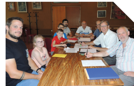
Les élèves de l'ALAE et les élus discutent code de la route

bâtiments vétustes aux 16 et 18 de la rue de la République sur le futur emplacement de la Maison du Projet et de la citoyenneté.